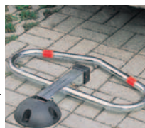
Hauteur rabattue du sol 8 cm.