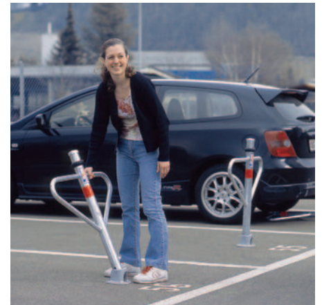
Autopa-spécial avec étriers latéraux – encore plus efficaces pour toutes les places de parking.