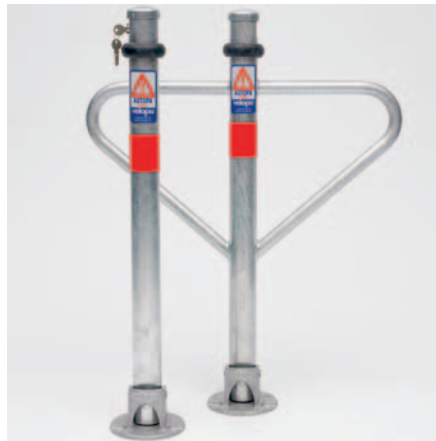
Les deux « chefs de parking » éprouvés de Velopa – il y a toujours une place libre.