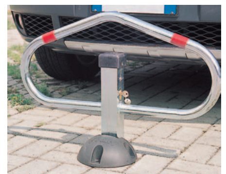
Parkhit avec élégant étrier tubulaire rond.